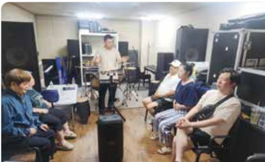
마음을 잇는 노래교실