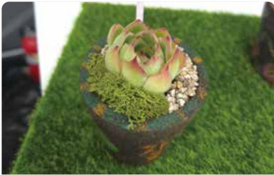
너를 기다리며 작품