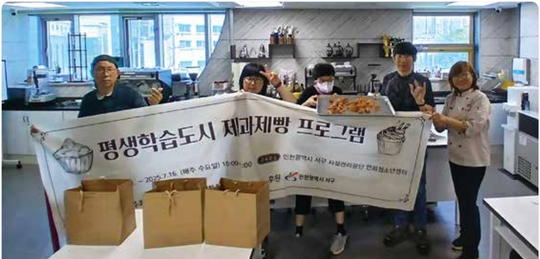
손끝으로 만드는 달콤한 세상