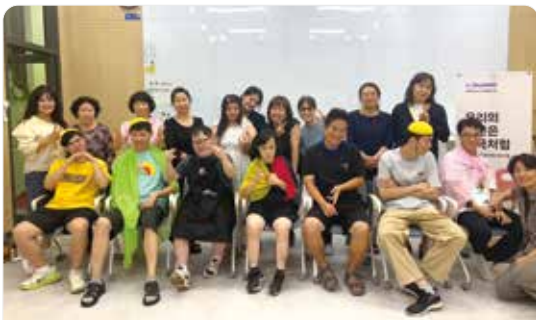
우리의 시간은 연극처럼