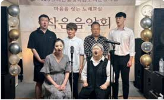
마음을 잇는 노래교실