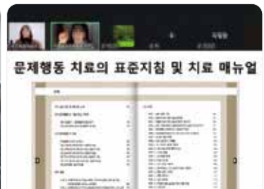
관계자 및 부모교육