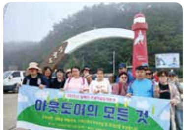
아웃도어의 모든 것