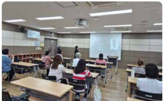
마음을 잇는 수어교실