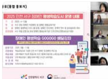
관계자 네트워크 회의