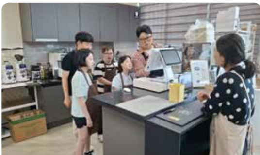
사랑을 굽는 베이커리카페