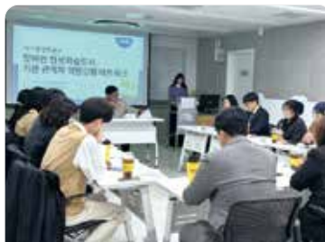
관계자 역량강화 네트워크