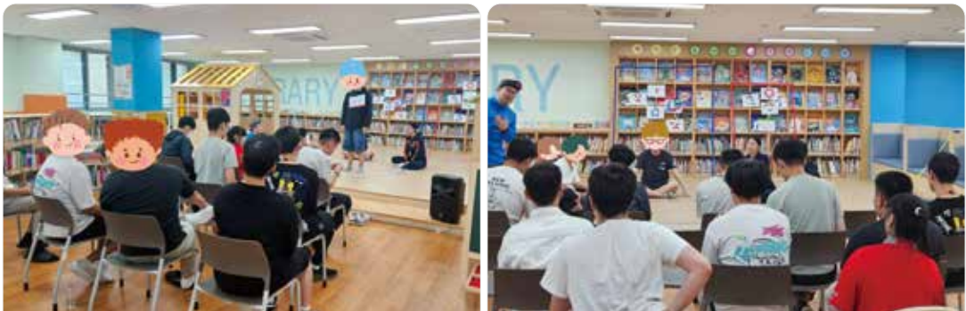
흐흠, 놀이-다 프로젝트