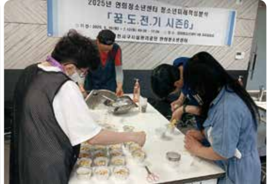
손끝으로 만드는 달콤한 세상