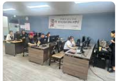
전자책 작가등록과 SNS브랜딩