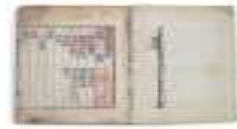
언해태산집요 (보물 제1088호)