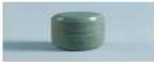
청자상감상약국명합 (보물 제646호)

Cheonggasanggamsangyakgukmyeonghap (Treasure No. 646)