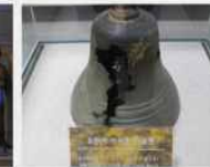
6.25전쟁 당시 총탄에 깨어진 종