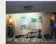
6.25전쟁 당시 국군과 북한군의 전투장비