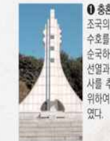
① 총흔탑 조국의 광복과 수호를 위하여 순국하신 애국선열과 호국용사를 추모하기 위하여 건립하였다.