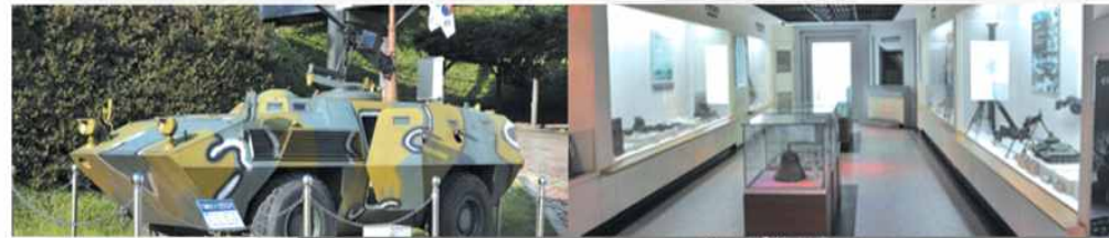
장갑차 감우재전승기념관 광장에 야외전시

1층 전시실을 음성지구 전투 상황을 살펴 볼 수 있도록 영상 빔프로젝트 시설을 갖춘 영상실, 6.25전쟁의 참상을 시기순으로 구성한 대형스크린, 6.25전쟁 당시의 모습을 볼 수 있는 타임비전 등의 시설을 갖춘 전시공간이다.