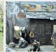
6.25전쟁 당시의 생활모습