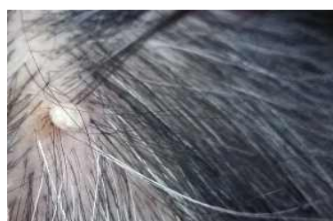
머리에 붙어 흡혈하고 있는 작은소피참진드기