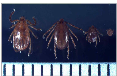
작은소피참진드기 암컷, 수컷, 약충, 유충 순서(눈금한칸: 1mm)

* 사망자수 : 17명('13)→ 21명('15)→ 54명('17)→ 41명('19, 잠정통계)