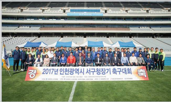
2017. 05. 14. 2017 서구청장기 축구대회