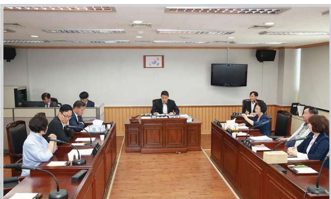
2017. 06. 08. 예산결산특별위원회