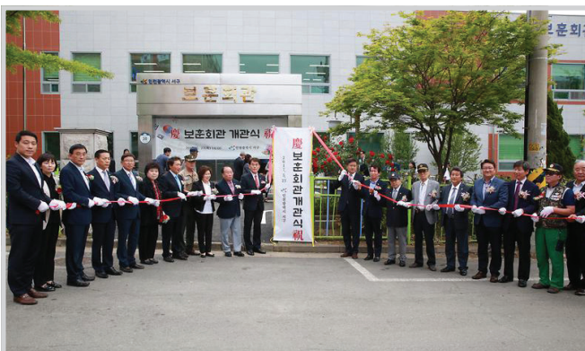
2017. 05. 23. 보훈회관 개관식