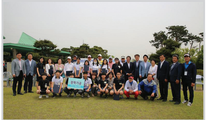
2017. 05. 30. 2017년 제6회 인천서구골프협회장배 골프대회