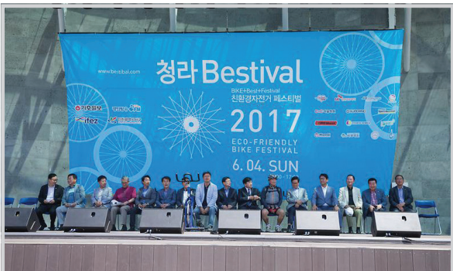
2017. 06. 04. 2017 청라 친환경 자전거 페스티벌