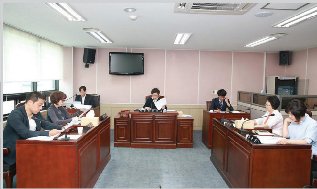
2017. 06. 09. 2017 제1차 의회운영위원회