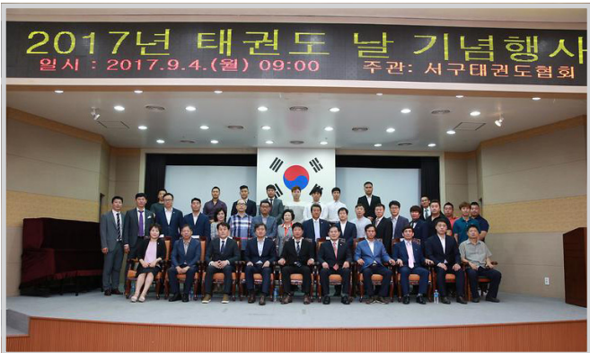
2017. 09. 04. 2017년 태권도의 날 기념행사