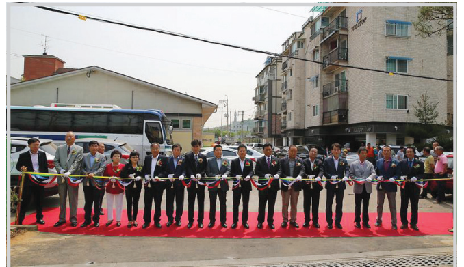
2017. 06. 20. 서인천농협 영농자재센터 개관식