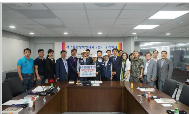
2017. 06. 22. 서구 통합방위협의회