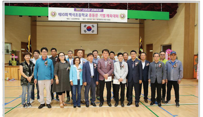
2017. 05. 21. 제10회 백석초등학교 총동문 기별 체육대회