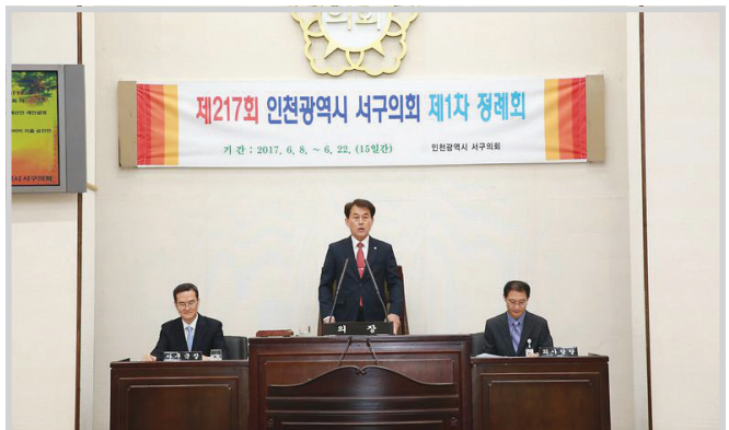
2017. 06. 08. 제217회 서구의회 제1차 정례회