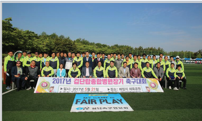
2017. 05. 21. 2017년 검단탑종합병원장기 축구대회