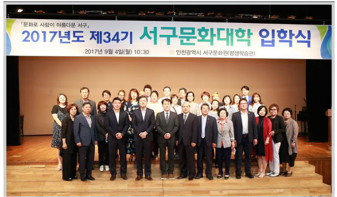
2017. 09. 04. 2017년도 제34기 서구문화대학 입학식