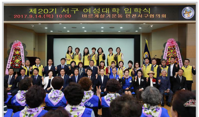
2017. 09. 14. 바르게살기운동 서구협의회 제20기 여성대학 입학식