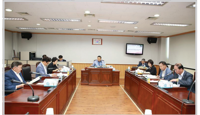
2017. 06. 09. 2017 제1차 복지도시위원회