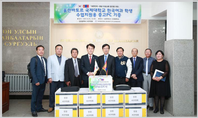
2017. 08. 25. 몽골 울란바토르 국제대학교 중고 PC 기증