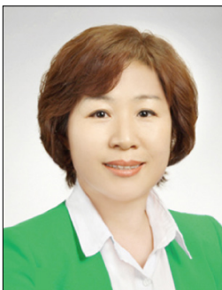
위원 박삼순 검암경서동, 청라 1,2,3동