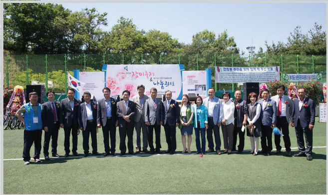
2017. 05. 27. 연희동 장미축제