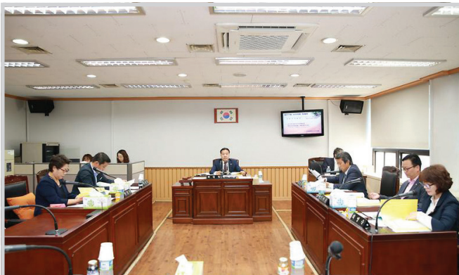
2017. 06. 09. 2017 제1차 기획총무위원회