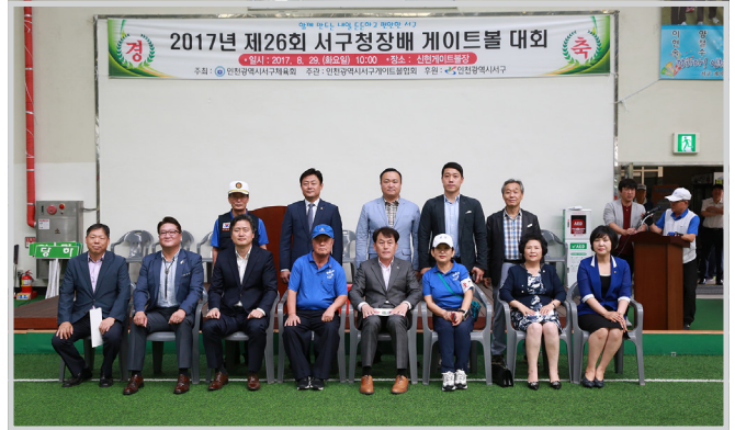
2017. 08. 29. 2017. 제26회 서구청장배 게이트볼 대회