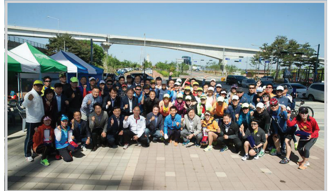
2017. 05. 16. 2017년 제3회 서구육상협회장배 건강달리기대회