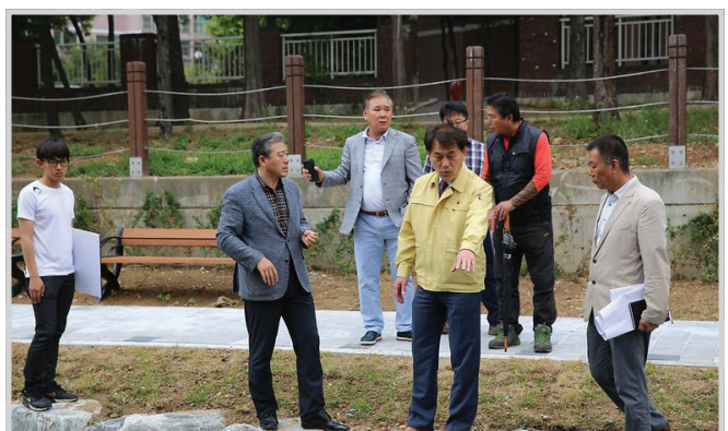
2017. 06. 09. 당하호 공원 내 시설물정비공사현장 방문