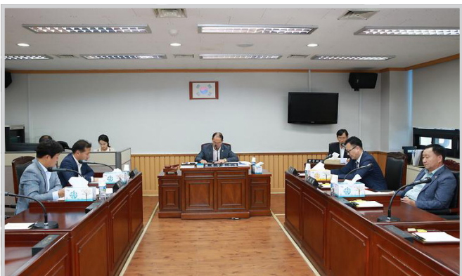
2017. 09. 13. 제2차 어린이집 사건 사고 방지 대책 마련 특별위원회