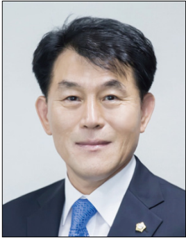
심우창 검단 1,2,3,4,5동