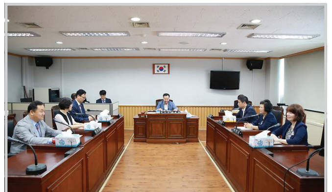
2017. 06. 22. 경인고속도로특위