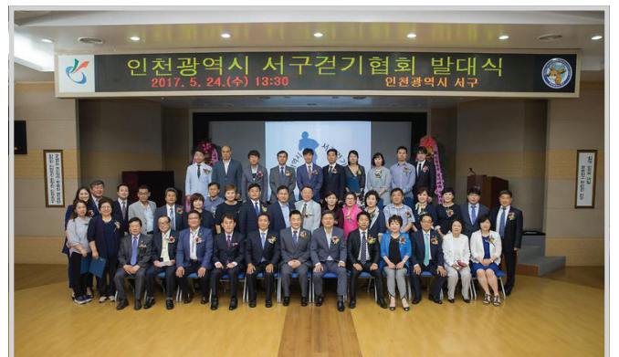
2017. 05. 24. 인천광역시 서구 걷기협회 발대식