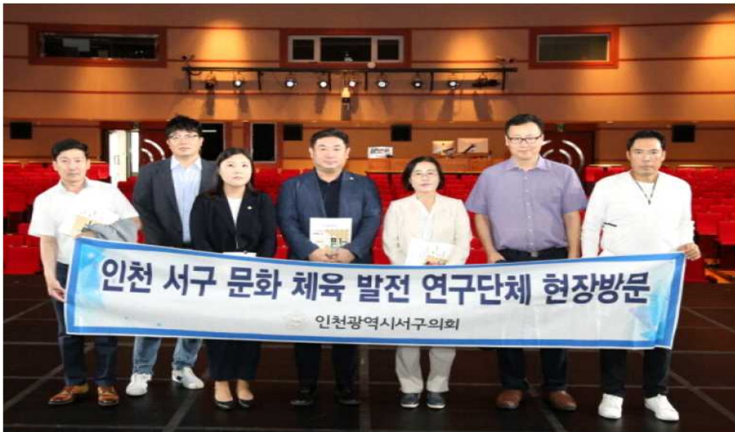
서구의회 선진사례 현장 답사 참가자들이 포즈를 취하고 있다.

[문찬식 기자] 인천시 서구의회가 문화, 체육 활성화를 도모하기 위해 선진사례를 견학했다.