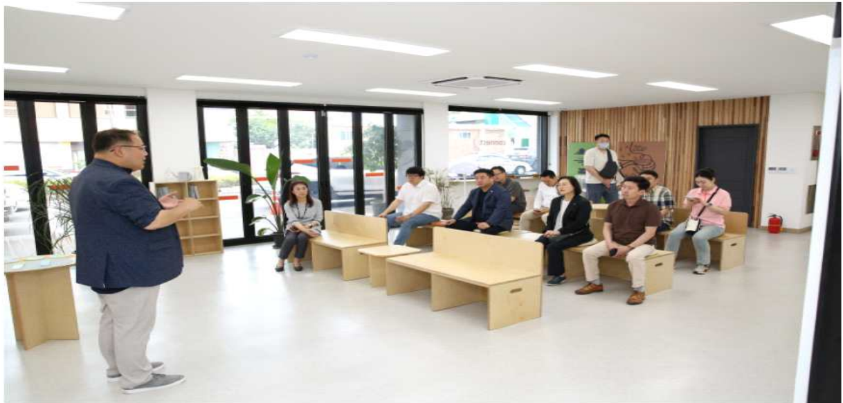
인천 서구의회 '인천서구 문화·체육 발전 연구단체'회원들이 강릉문화재단을 방문해 관계자 설명을 듣고 있다.

인천 서구의회 의원연구단체'인천서구 문화·체육 발전 연구단체'는 지난 25일 강원도 강릉시를 찾아 주민의 문화 환경 등을 확인하는 비교시찰을 진행했다.