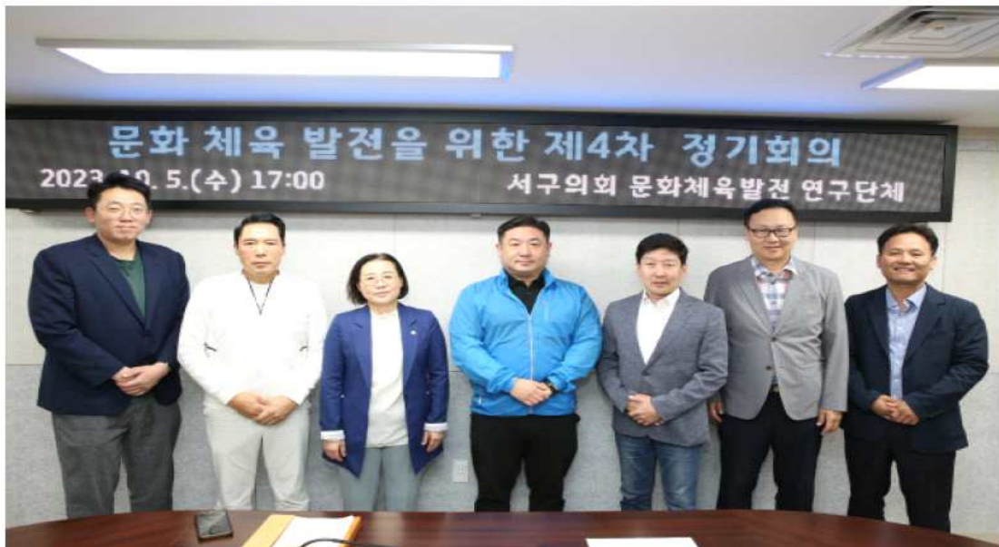
인천 서구의회 문화·체육 발전 연구단체가 정기회의를 마치고 사진 촬영을 진행하고 있다.

인천 서구의회 의원연구단체 '인천 서구 문화·체육 발전 연구단체'가 지역 발전을 위해 머리를 맞댔다.