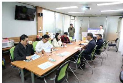
수상레저 연구단체는 청라호수공원의 수질 개선을 위한 벤치마킹 (인천=인천 서구의회)

매일일보 = 박미정 기자 | 인천 서구의회 '서구 수상레저 활성화를 위한 연구단체(대표의원 송이)는 고양시 일산동구에 위치한 일산호수를 방문하여 고양특례시청의 수질 관리 정책에 대한 세부적 사항을 배웠다고 14일 밝혔다.