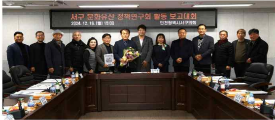
지난 16일 인천 서구의회에서 진행된 '서구 문화유산 정책연구회' 연구활동 성과보고대회에서 상무장 연구회 대표의원과 송송한 구의회 의장 등 참석자들이 기념 촬영을 하고 있다.

인천 서구의회 의원연구단체인 '서구 문화유산 정책연구회'가 지난 16일 연구활동 성과보고대회를 개최했다.