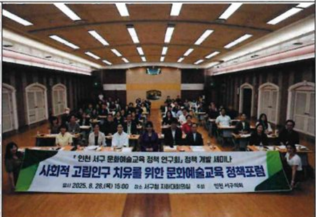
사회적 고립인구 치유를 위한 문화예술교육 정책포럼