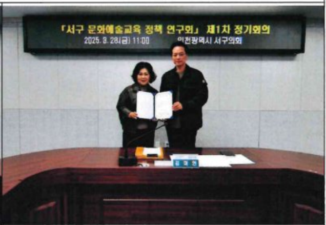
자문위원 위촉식 2