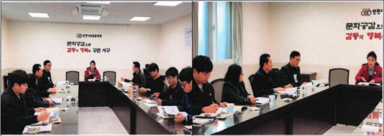
문화예술교육 관계 부서 간담회