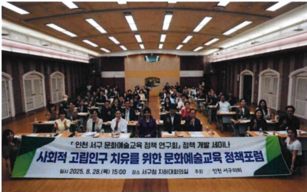
인천 서구의회 '서구 문화예술교육 정책 연구회'가 개최한 '사회적 고립인구 치유를 위한 문화예술교육 정책포럼'

(인천=국제뉴스) 이병훈 기자 = 인천 서구의회 의원연구단체인 '서구 문화예술교육 정책 연구회'는 28일 '사회적 고립인구 치유를 위한 문화예술교육 정책포럼'을 개최했다. 행사에는 관계 공무원, 관련 기관, 예술인 등이 참석했다.