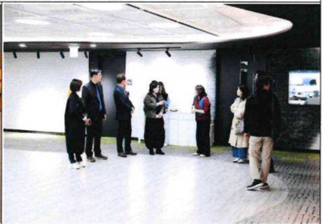
우수사례 비교시찰 - 서울문화예술교육센터 용산