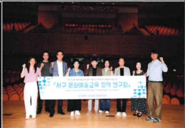
우수사례 비교시찰 - 성남문화재단(성남아트센터)