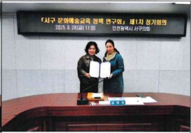
자문위원 위촉식 3