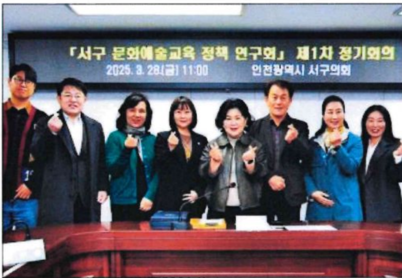
서구의회 문화예술교육 정책연구회가 정기회의를 개최했다.