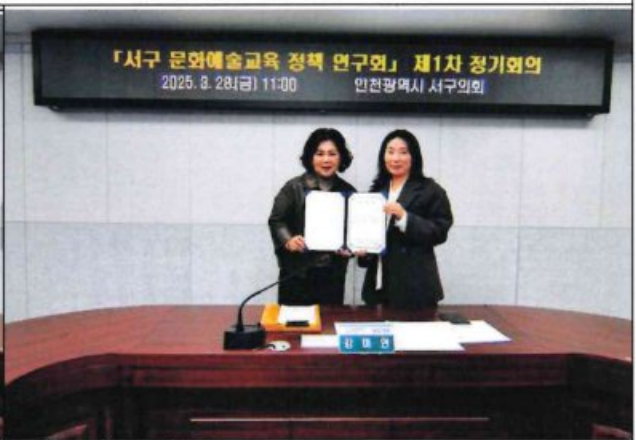
자문위원 위촉식 1