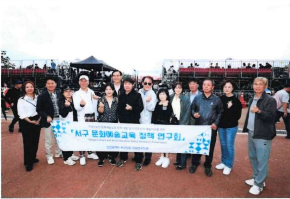
서구 문화예술교육 정책 연구회가 수원화성문화제 비교시찰을 마치고 기념촬영을 하고 있다

인천 서구의회 의원연구단체 '서구 문화예술교육 정책 연구회'는 지난 28일 수원화성박물관 및 수원화성 문화제 우수사례 비교시찰을 실시했다.