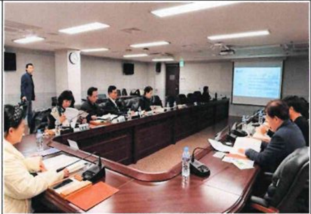
제3차 정기회의 및 최종보고회