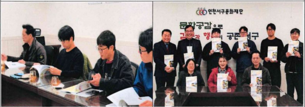
문화예술교육 관계 부서 간담회