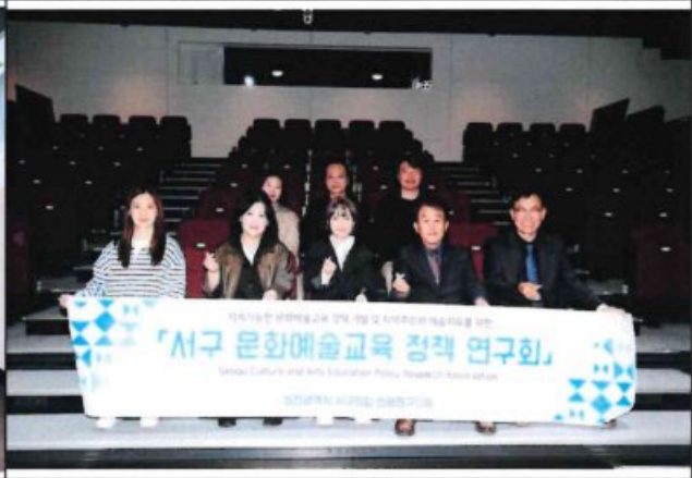
우수사례 비교시찰 - 서울문화예술교육센터 용산