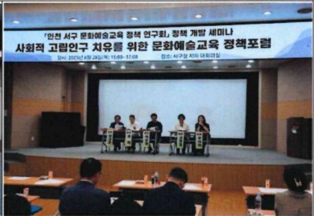
사회적 고립인구 치유를 위한 문화예술교육 정책포럼