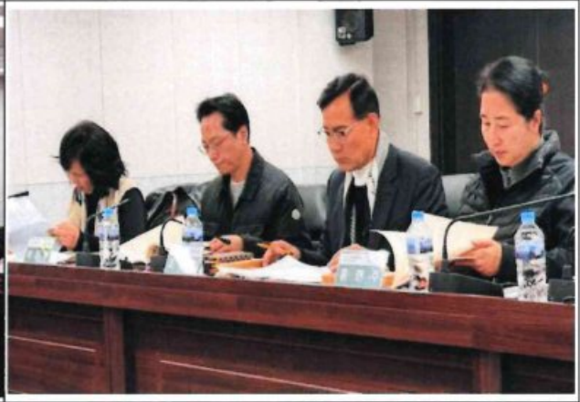
제3차 정기회의 및 최종보고회