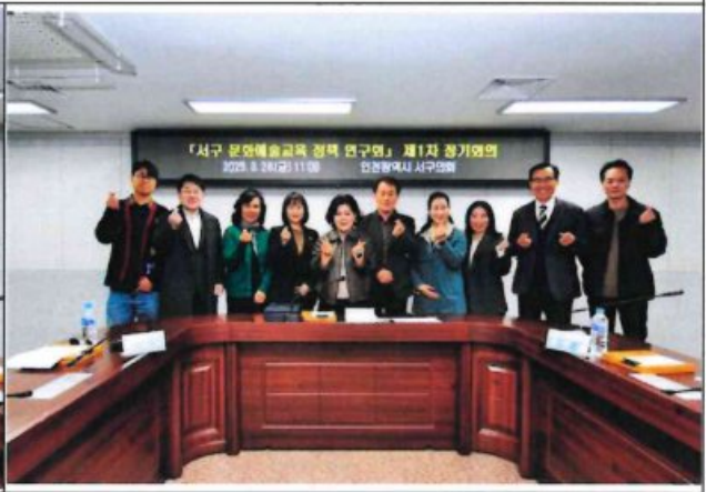
제1차 정기회의 및 자문위원 위촉식 후 단체사진