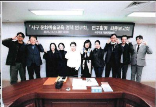
제3차 정기회의 및 최종보고회