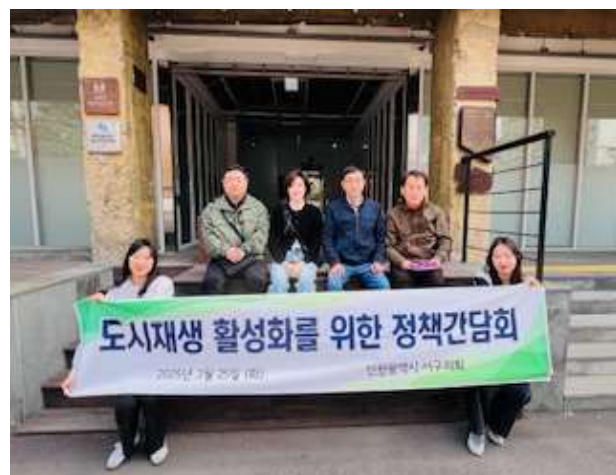
제주 도시재생지원센터 기관방문