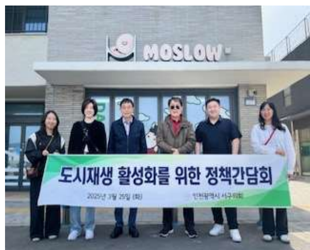
대정특화체험센터, 신영물행복센터 기관방문