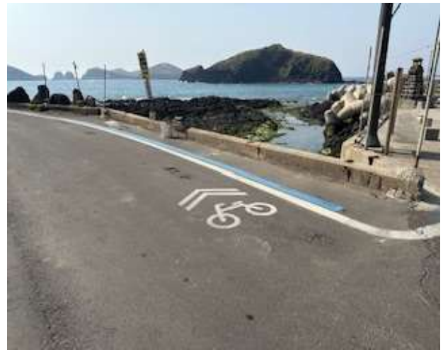
제주도 자전거도로 벤치마킹 사례 - ② 자연경관을 활용한 친환경 도로 조성