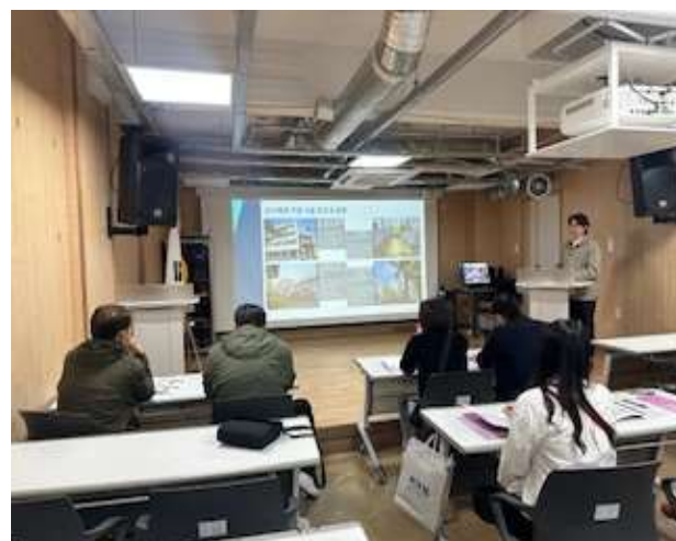
2일차 기관방문(도시재생 활성화를 위한 정책간담회 개최)