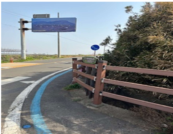
제주도 자전거도로 개선필요 사례 - ① 도로폭이 좁아 위험성이 있음