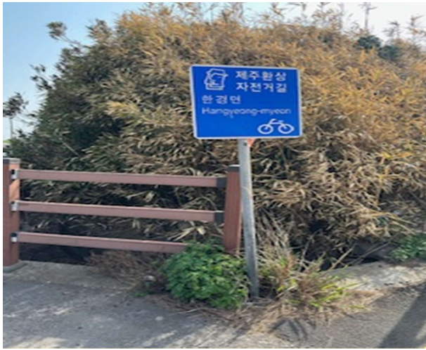
제주도 자전거도로 벤치마킹 사례 - ① 표지판 설치로 도로 이용 수월