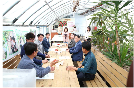
• 리얼 스마트팜