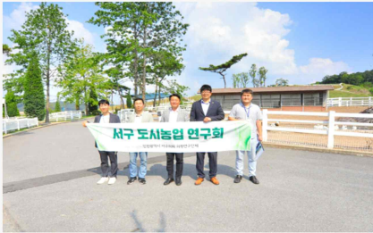
도시농업연구회에서 활동하는 인천 서구의회원들이 지난 11일(여) 이틀간 중계 송정리, 중계 연성사 등에 위치한 도시농업선진지를 견학했다.