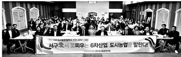
인천 서구의회 의원연구단체인 '서구 도시농업 연구회'는 지난달 30일 연구회 소속 의원과 전문가 패널 4명, 지역 기관장, 관계 공무원, 서구 주민 등 200여 명이 참여한 가운데 포럼을 가졌다.