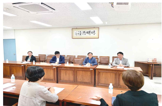
• 풍양보건소 치매안심센터