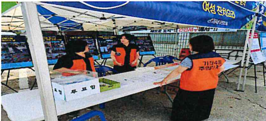
주민총회 사전 투표현장