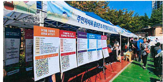
주민총회 당일 투표 현장