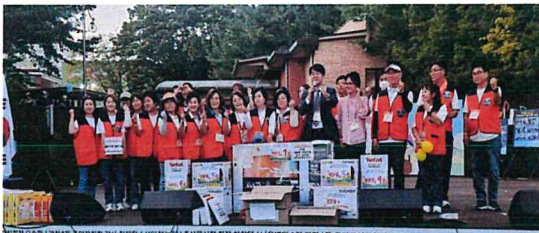
주민 총회 기념 촬영