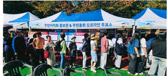
주민총회 당일 투표 현장