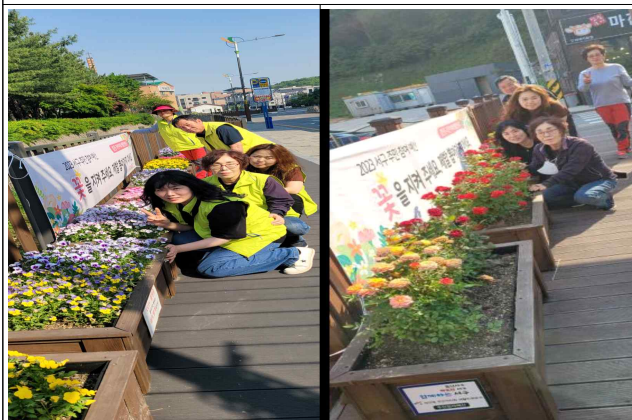
꽃길 만들기 유지·관리