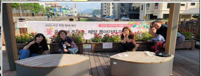
꽃길 만들기 식재 행사