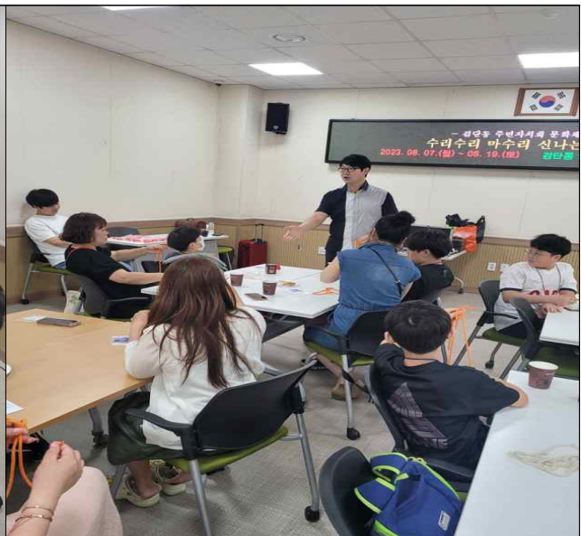
신기한 마술교실 교육 사진