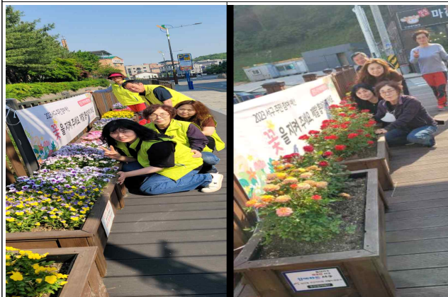
꽃길 만들기 유지·관리