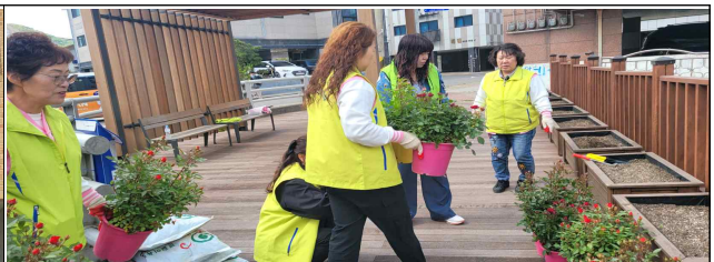
꽃길 만들기 식재 행사