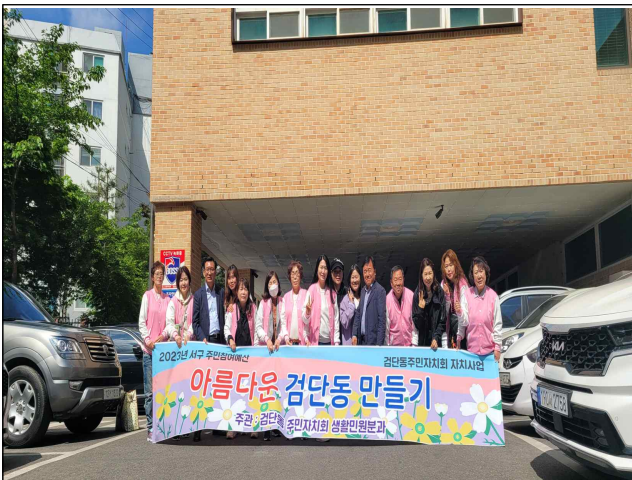
아름다운 검단동 만들기 단체 사진