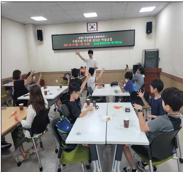
신기한 마술교실 교육 사진