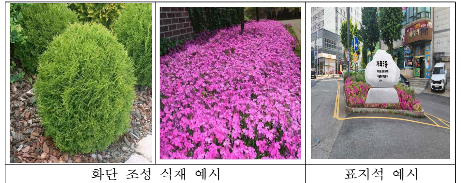
화단 조성 식재 예시