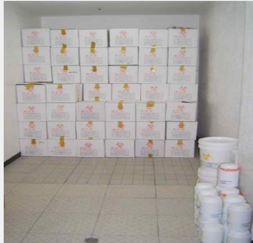
의료폐기물 보관창고 전경