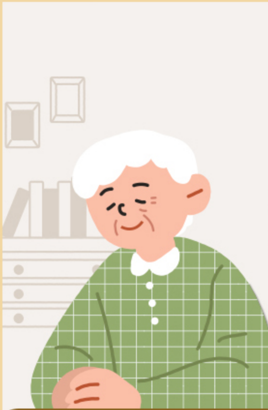
① 독거노인 등 취약계층