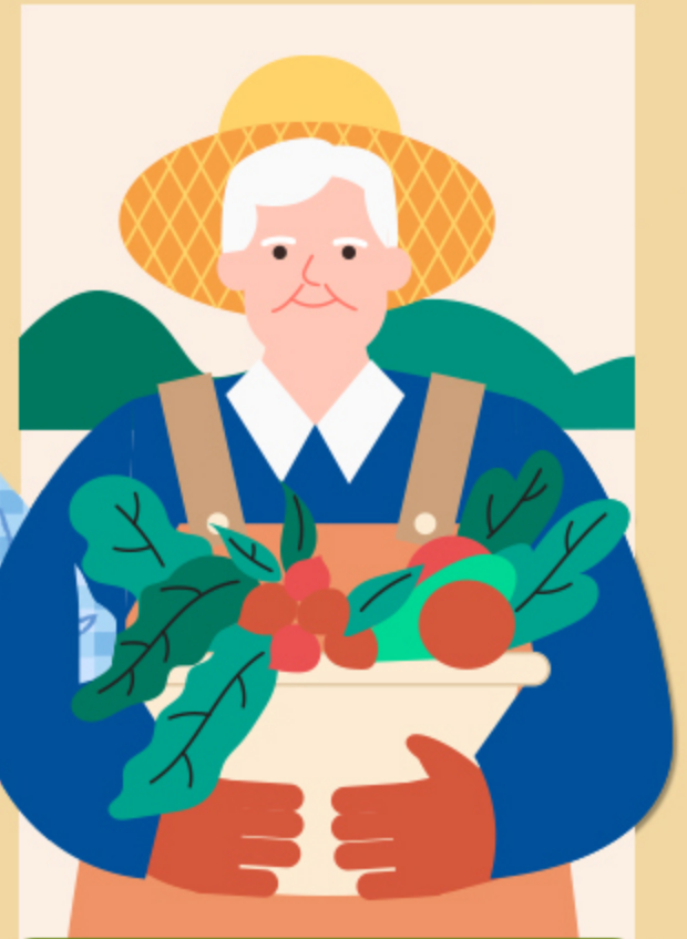
③ 고령층 논밭 작업자