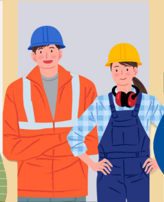
② 공사장 야외근로자