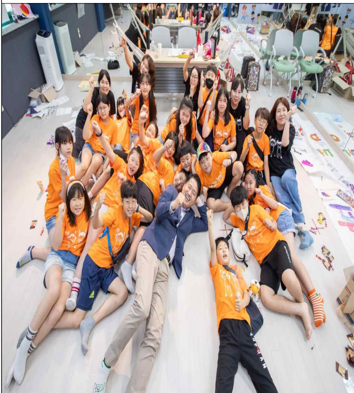
아동인권옹호 캠페인 활동