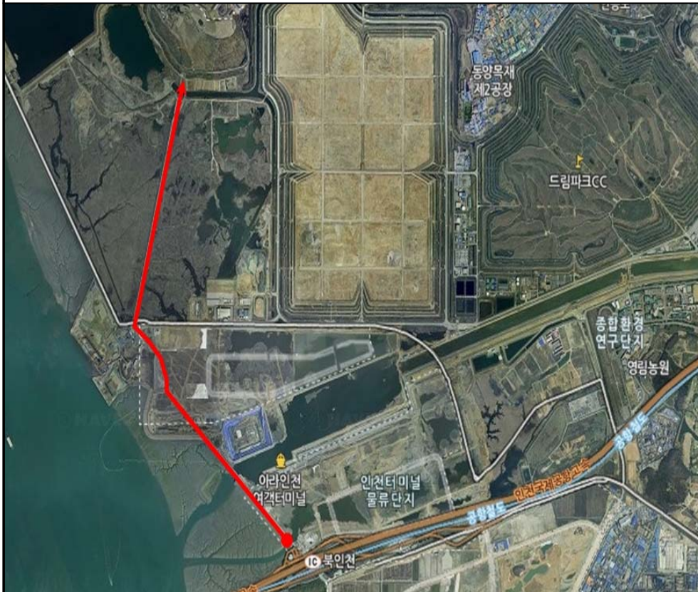
변 경 후