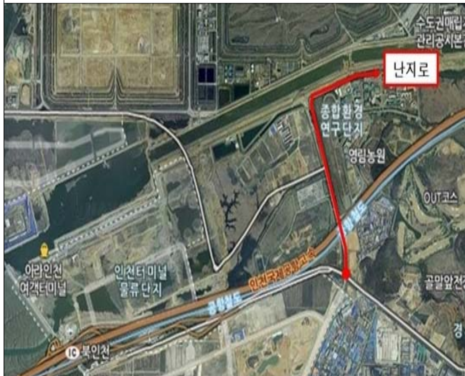
변 경 후