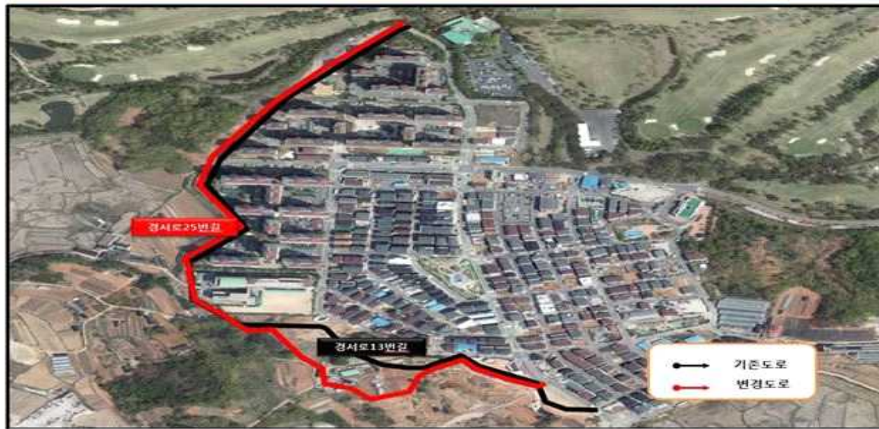
경서2구역 일부 도로명 변경(안)

※ 시작지점 경서동 산165-10은 종전지번으로 경서2구역 도시개발사업 완료시 변경될 수 있습니다.