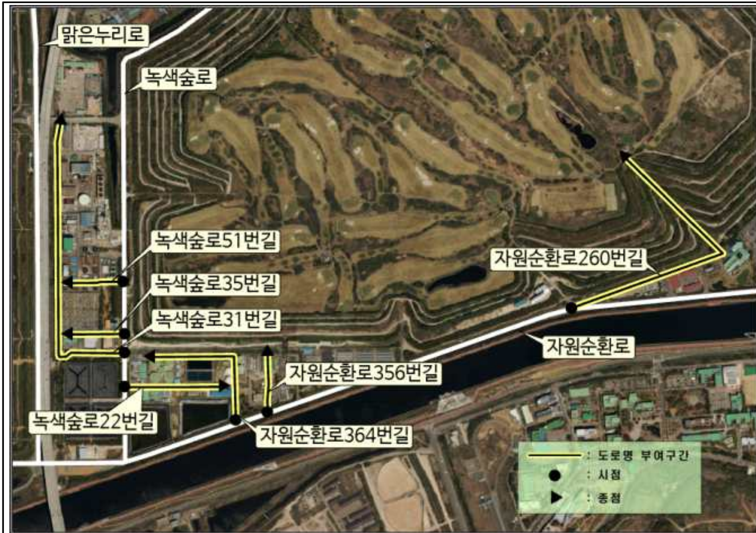
자원순환로260번길, 녹색숲로22번길 등