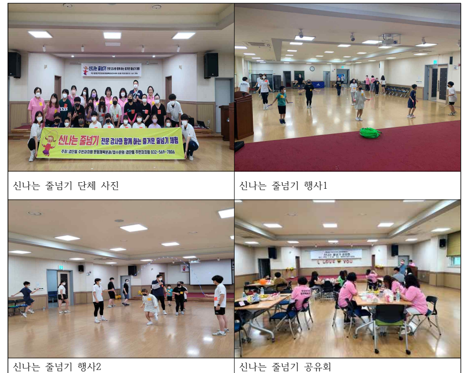
신나는 줄넘기 단체 사진