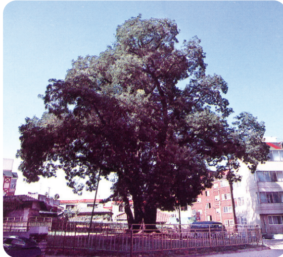
신현동 회화나무(천연기념물 제315호)