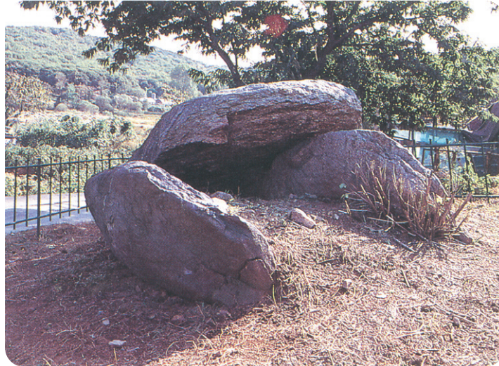
대곡동 지석묘군(시 기념물 제33호)