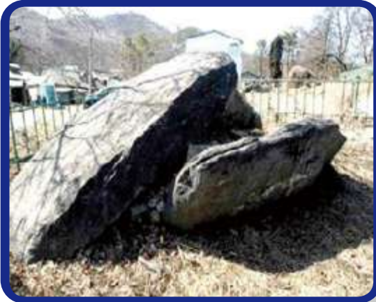
시 기념물 제33호 City Monument No. 33