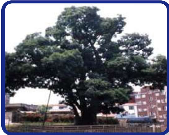
천연기념물 제315호 Natural Monument No.315