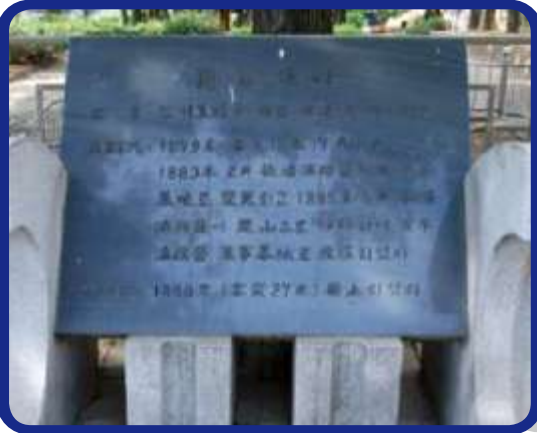
비지정문화재 Undesignated Cultural Asset