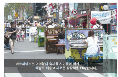
아트피아노는 여러분의 축제를 시민들과 함께 예술로 채우고 새로운 상상력을 Play합니다.