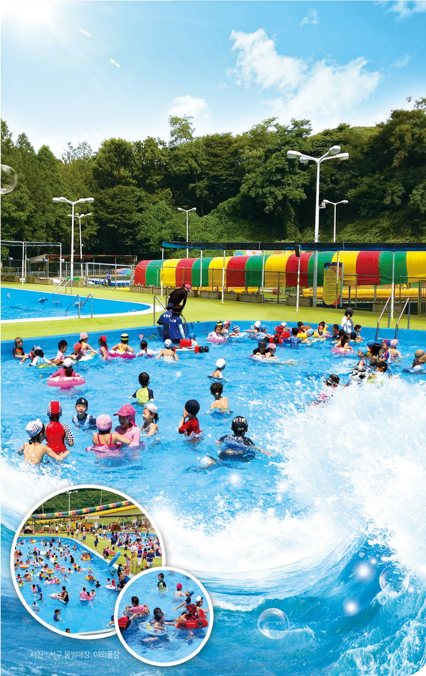
사진 : 서구 물썰매장, 야외물장