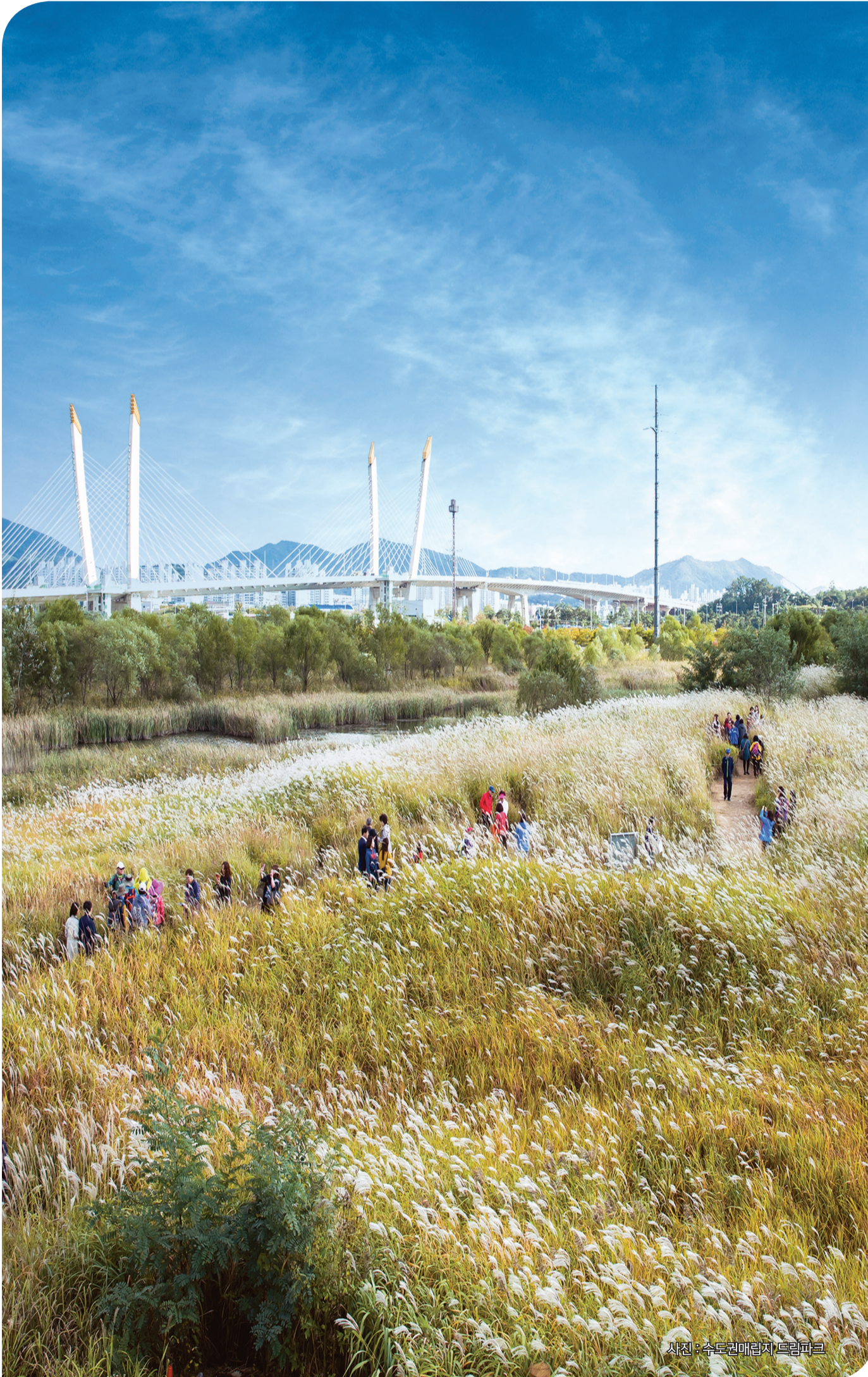
사진 : 수도권매립지 드림파크