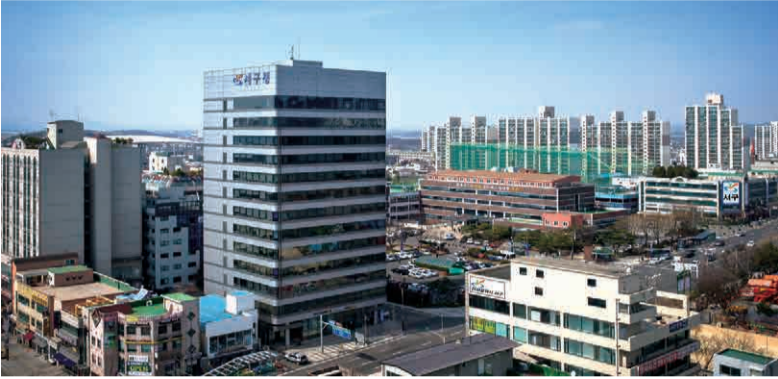
※ 제2청사 : (구)경인빌딩

인구 50만 시대에 맞는 청사 확충 및 재배치 계획에 따라, 구민 편의 증대와 보다 나은 대민행정서비스 제공을 위해 일부 부서가 아래와 같이 이전해 업무를 개시합니다.