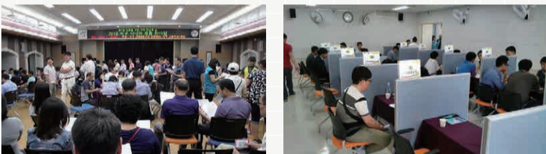
문의) 서구 기업&일자리 지원센터 ☎ 560-5809