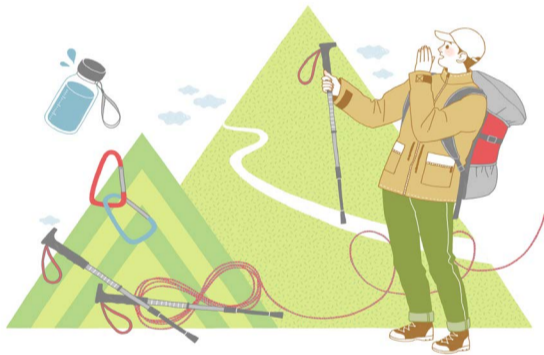
문의) 서부소방서 예방안전과 소방홍보팀 ☎ 723-5465