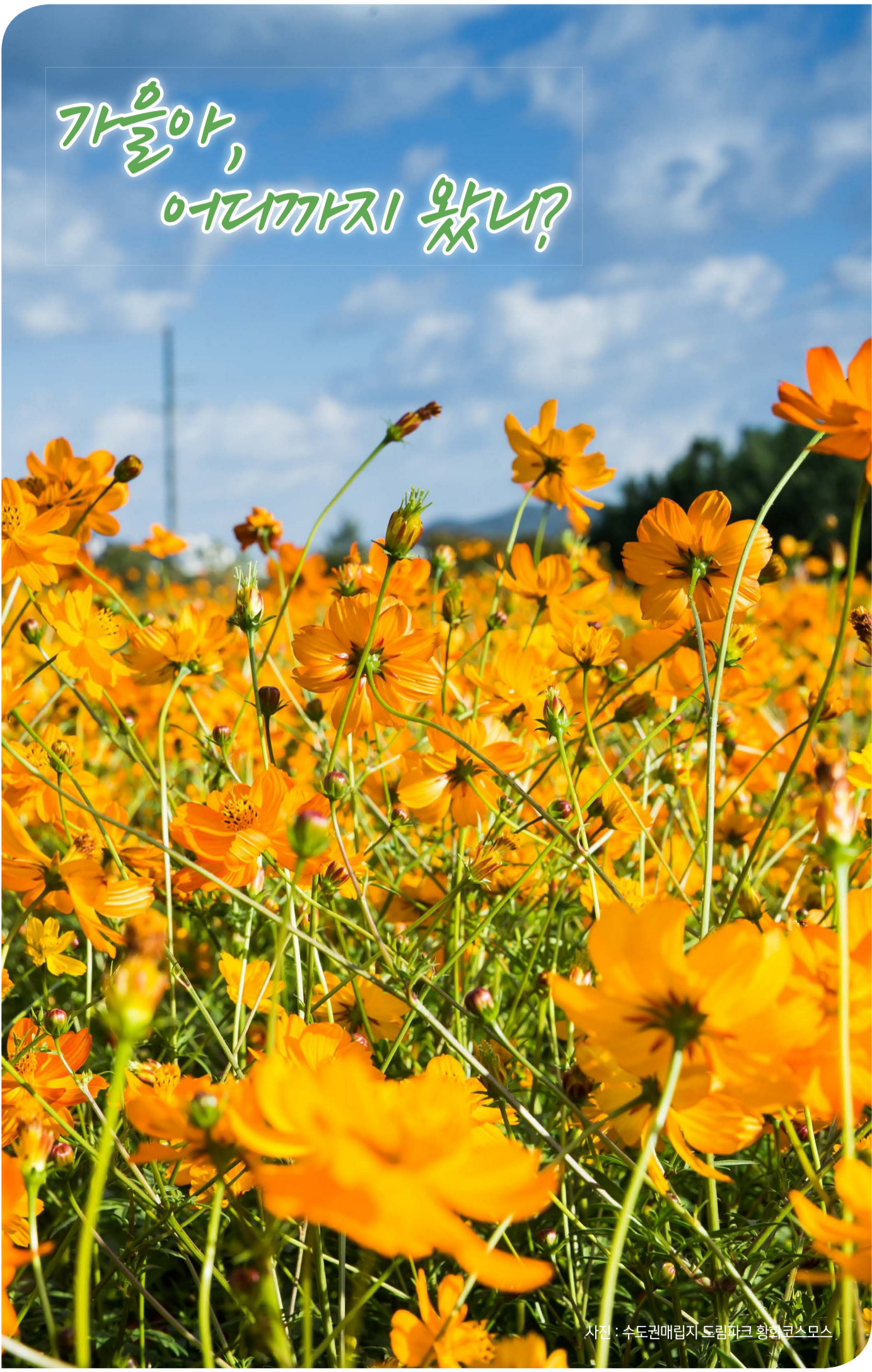
사진 : 수도권매립지 드림파크 황화코스모스