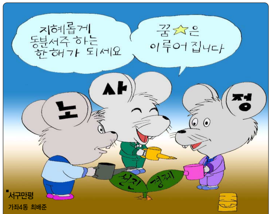
서구만평 가좌4동 최배준