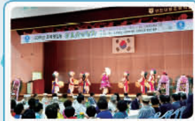
2019 오류왕길동 경로워안잔치 (2019.10.3)