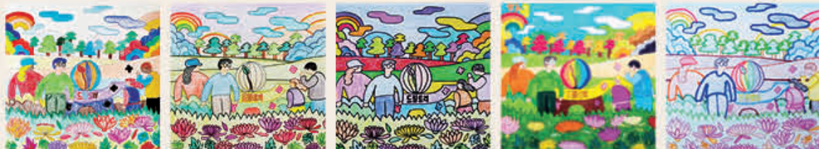
김선희 님 김지우 님 김태경 님 이아원 님 장연지 님

컬러링 이벤트에 당첨되신 다섯 분께는 1만 원 상당의 상품권을 모바일로 보내드립니다.