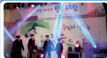
제9회 주민이 만드는 작은 음악회(2019.10.5)