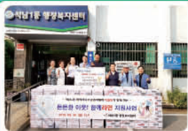
튼튼한 이웃! 함께라면 지원사업 전달식 (2019.9.30)