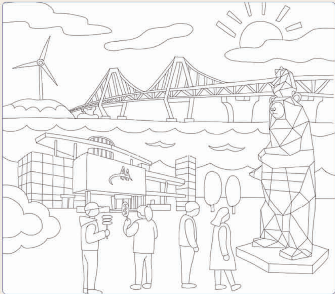
<10월호 컷러링 당첨자>

인천국제공항으로 가는 길, 서해의 아름다운 낭만이 펼쳐진 곳인 영종대교휴게소입니다. 심과 즐거움이 가득한 영종대교휴게소에 감성을 더해보세요.