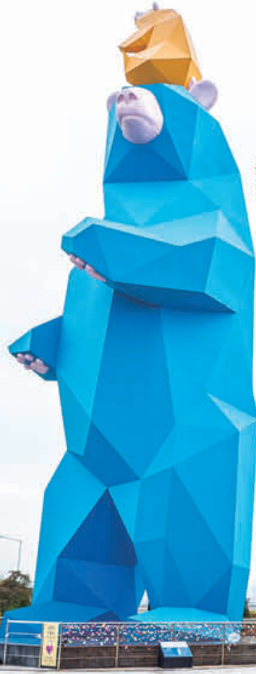
높이 23.57m로 세계 최대 철제 조각작품으로 기네스북에 등재된 포춘베어