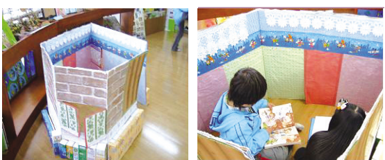
가좌2동 주민자치센터 '푸른샘 어린이도서관'에서

는 지난 3월 22일 '재활용품으로 집만들기' 라는 어린이 체험교실을실시했다.