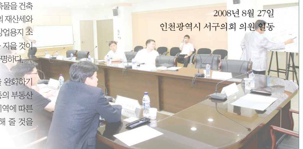
2008년 8월 27일 인천광역시 서구의회 의원 일동