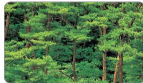
감염되지 않은 건강한 소나무

○ 또한 그동안 소나무재선충병 피해가 발생되지 않았던 잣나무림에서도 재선충병이 발생(경기 광주 초월읍·중대동 2곳)되어 재선충병이 우리나라 전지역이 발생될 수 있다는 판단하에 전국을 상대로 예찰활동을 더욱 강화하고자 지역주민의 참여를 요청하오니 생활권 주변에서 아래와 같은 증상의 소나무류를 발견시 즉시 연락을 주시어 소나무류 재선충병이 더 이상 확산되지 않도록 적극 협조하여 주시기 바랍니다.