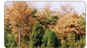
재선충에 감염된 소나무