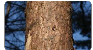
재선충에 감염된 소나무