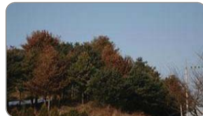
재선충에 감염된 소나무