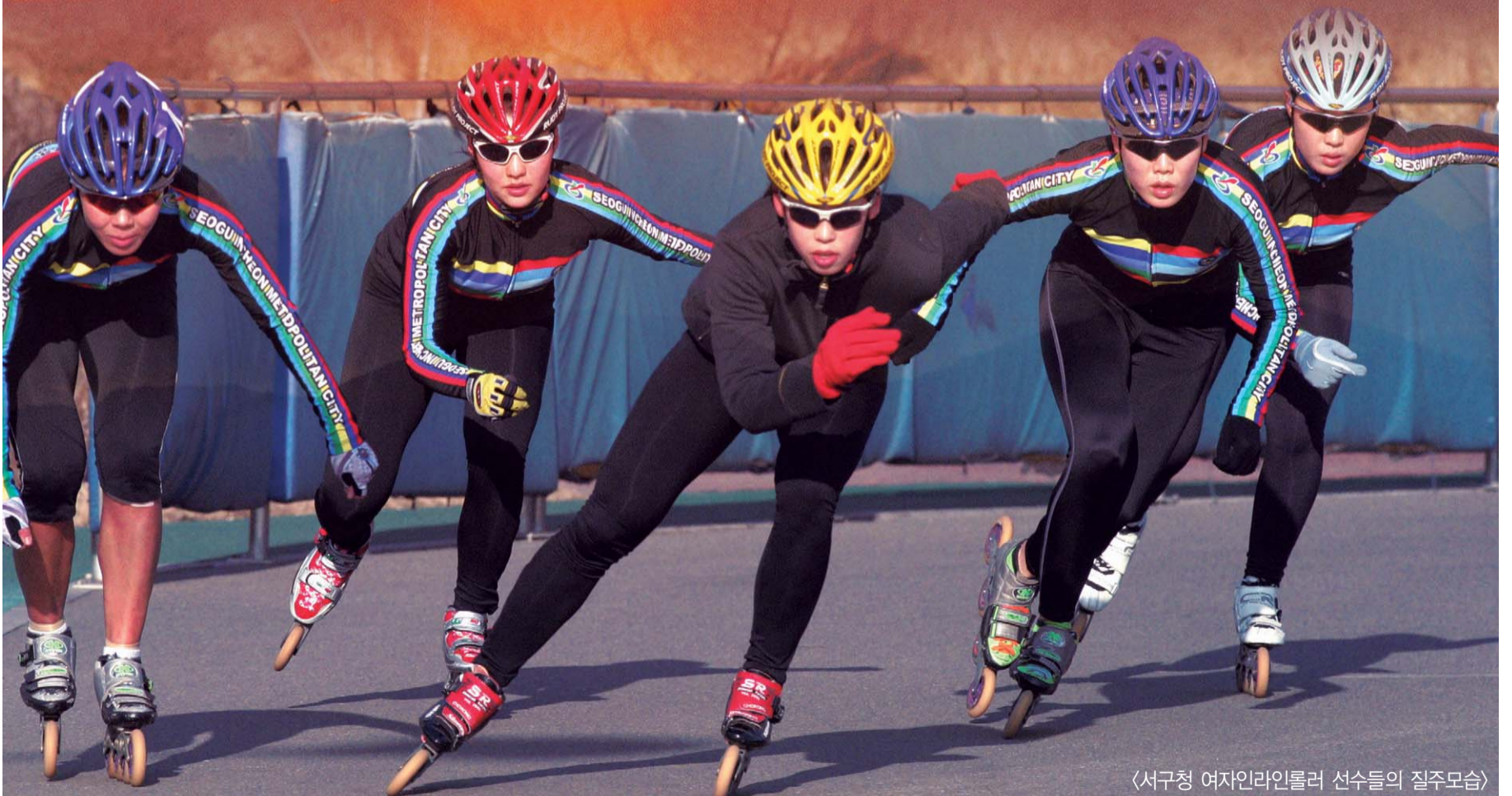
〈서구청 여자인라인롤러 선수들의 질주모습〉