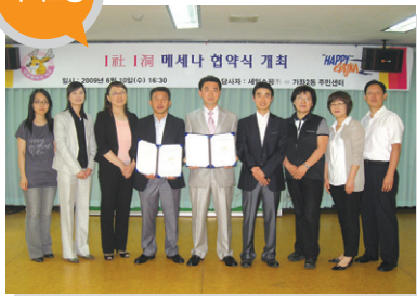
결연사업체 _ 세일소핑 지원 내용 _ 저소득층 지원사업