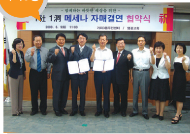
결연사업체 _ 염광교회 지원 내용 _ 저소득층 지원사업