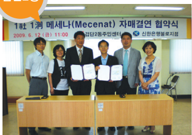
결연사업체 _ 신한은행 불로지점 지원 내용 _ 축제지원 및 봉사활동 공동 참여