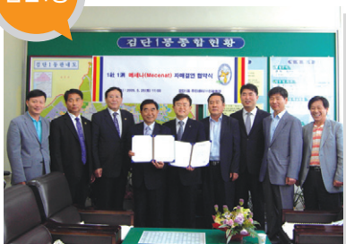
결연사업체 _ 인광환경(주) 지원 내용 _ 저소득층 지원사업