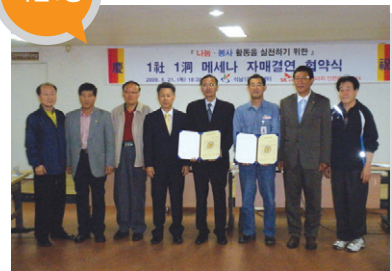
결연사업체 _ SK에너지(주)인천컴플렉스 지원 내용 _ 문화사업 및 복지사업 지원