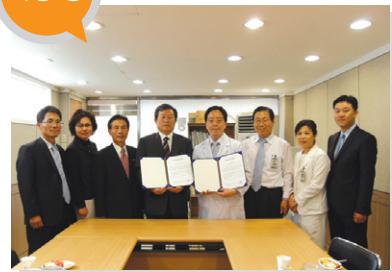
결연사업체 _ 참사랑병원 지원 내용 _ 소외계층 의료지원서비스