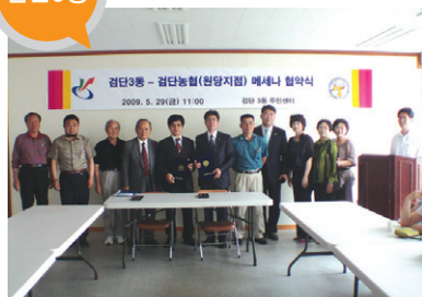
결연사업체 _ 검단농협(원당지점) 지원 내용 _ 학교지원 및 결식아동 후원 등