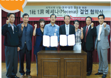
결연사업체 _ SK에너지(주)인천컴플렉스 지원 내용 _ 도서구입비 및 저소득층 지원 (년간/4,200 천원 )