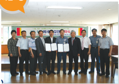
결연사업체 _ SK에너지(주)인천컴플렉스 지원 내용 _ 저소득층 복지사업