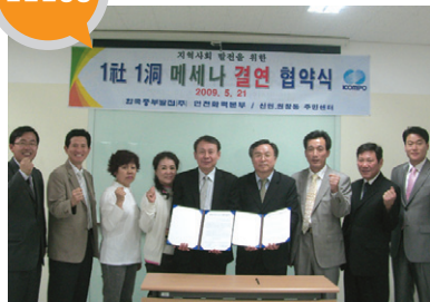
결연사업체 _ 한국중부발전(주)인천화력본부 지원 내용 _ 저소득층 육영사업 및 도서관 지원사업 (년간/15,000천원 )