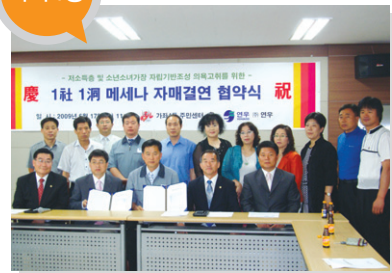
결연사업체 _ (주)연우 지원 내용 _ 학교, 경로당 급식지원, 보육시설 급식비 지원 예정