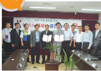
결연사업체 _ 한국전력공사 서인천지점 지원 내용 _ 저소득층 복지사업