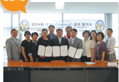
결연사업체 _ 태양식품, 대하상사, 조개를 까서 구워요, 찬양교회 지원 내용 _ 저소득층 지원사업 등