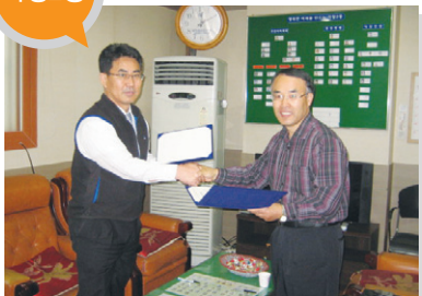
결연사업체 _ 가정교회 지원 내용 _ 결식아동지원 및 독거노인 반찬지원 등