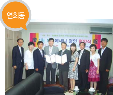
연희동 결연사업체 _ 인천연희감리교회 지원 내용 _ 어려운 이웃 지원 청소년 문화활동 지원