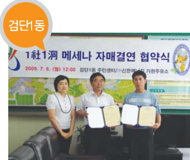
검단1동 결연사업체 _ (주)신한에너지 기현주유소 지원 내용 _ 경로당 운영비 저소득층 자녀 학원수강료 매월 지원