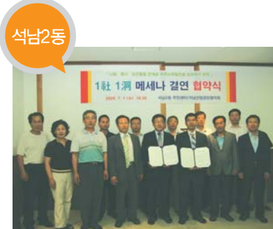
석남2동 결연사업체 _ 석남산업공단협의회 지원 내용 _ 경로당 점심대접 저소득층 복지사업

구는 결식아동 급식권의 종이발권으로 인하여 발생하는 급식권의 훼손·분실 및 부정사용의 문제점을 예방하고 보조금 집행의 투명성을 확보하기 위해 전자카드를 도입하기로 결정하고, 지난 7월 1일 (주)신한은행과 "결식아동 급식지원을 위한 전자카드 공급 및 운영 시스템 제공에 대한 협약"을 체결했다. 구는 결식아동 급식지원 전자카드 도입을 위해 지난 6월 1일 『결식아동 급식지원사업 전자카드 도입 운영 계획』을 수립하고, 6월 4일부터 10일까지 위탁업체 모집 공고를 통해 (주)뱅크토피아와 (주)신한은행, (주)유스카드 3개 업체의 신청 접수를 받아, 6월 12일 『서구 아동급식위원회』 심의를 거쳐 (주)신한은행을 위탁운영체로 선정했으며, 지난 7월13일부터 각동 주민센터에서 결식아동 급식지원 전자카드를 보급하여 서비스를 시행중이다. 복지서비스과 여성이동팀 ☎ 560-5730