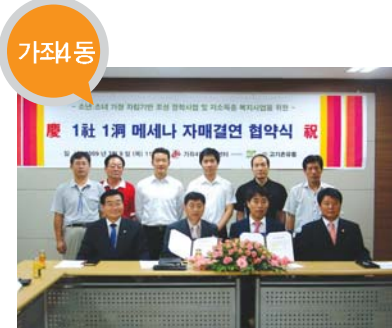
가좌4동 결연사업체 _ 고기촌 유통(주) 지원 내용 _ 저소득층 복지사업