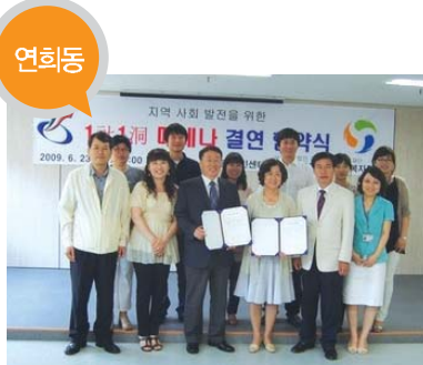
연희동 결연사업체 _ 사회복지법인 김리회 태화복지재단 인천기독교종합사회복지관 지원 내용 _ 어려운 이웃발찬지원 등