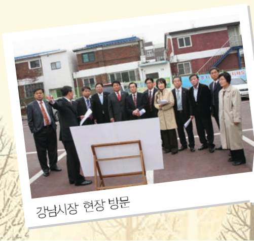
강남시장 현장 방문