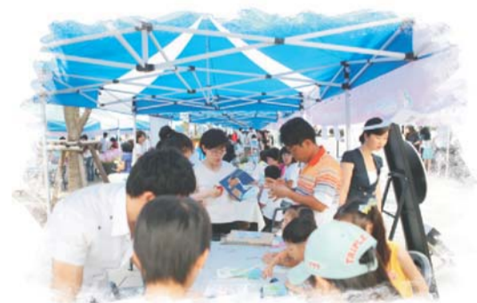
주민생활지원과 주민생활지원팀 560-4290

구 관계자는 “이번 박람회를 통해 주민에게 즐거운 복지문화 체험의 기회를 준 것과 복지는 늘 주민과 함께 호흡하고 있음을 주민에게 알려주었던 좋은 기회라고 평가하면서 앞으로도 민간과 공공이 함께 서구의 복지 발전을 위하여 노력할 것을 다짐하고 이번 행사에 참여와 후원을 아끼지 않은 기업체와 자원봉사자들에게도 감사의 인사”를 전했다.