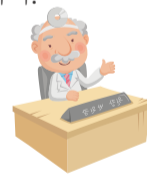
나은병원 유방갑상선센터 외과 전문의 이재창 과장

건강한 유방을 지키기 위해서는 스스로 체크하는 습관이 중요하며, 이상증상 발견시 조기진단을 위해서 빠른 시일내에 전문의와 상의하는 것이 좋습니다.