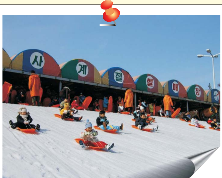
서구 사계절썰매장과 눈광장이 12월 11일 개장합니다. 가족·친구들과 함께 외까지 잊지 못할 겨울 추억을 만드세요.