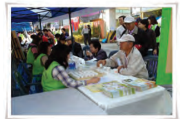
문의) 건강증진과 ☎560-5043