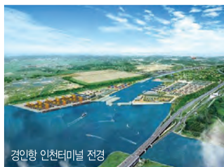
경인항 인천터미널 전경