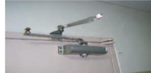
〈도어체크 훼손 및 탈락〉