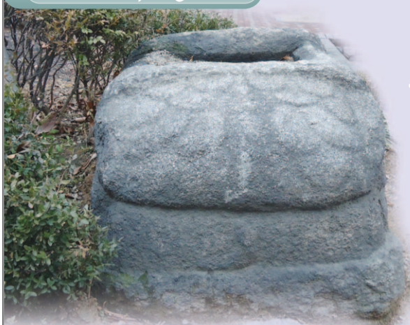
현재 서구청사 내에 있는 공해루 초석

중심성(衆心城)은 서구와 계양구 경계를 이루는 경명현(서구 공촌동 산1번지 일원)을 중심으로 하여 동서의 능선을 따라 축조한 일자(一字) 형태의 산성이었다. 인천 앞바다에서의 병인·신미양요(1866)와 운양호사건(고종12년:1875)으로 제물포 개항을 앞둔 당시, 고종16년(1979)에 서해방어를 위한 화도진과 연희진이 설치되었다. 이는 조선의 문호 개방과 함께 국방의 중요성을 절감하게 되었고 특히 서해의 방비는 인천항과 강화수로의 중요성을 심각하게 인식하게 되었기 때문이다. 하지만 결국 제물포가 개항하게 되는 임오군란 직후(1882)에 화도진과 연희진은 폐쇄되고 후속 방비책으로 고종20년(1883)에 당시 서곶에서 계산동으로 넘어가는 경명현(징맹이고개, 징매고개, 천명고개, 수주고개)에 해안 방어와 강화수로 방어를 위한 중심성이 세워지게 된 것이다.