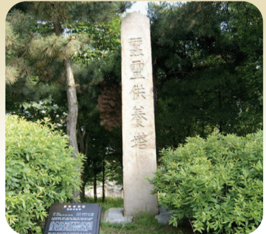
시립박물관 우현마당에 서 있는 잠령공양탑

인간을 위해 죽은 누에들을 기리는 것이 나뭇잎은 없지만, 일제의 강압으로 고치를 거두던 우리 조선인 농민들은 그들로부터 실제 누에만도 못한 대접을 받은 사실을 생각하면 ‘누에에게만 따뜻한 품성을 보인’ 일제의 본