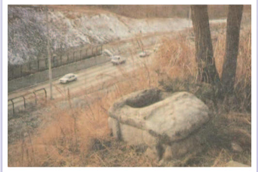
중심성지 공해루 초석