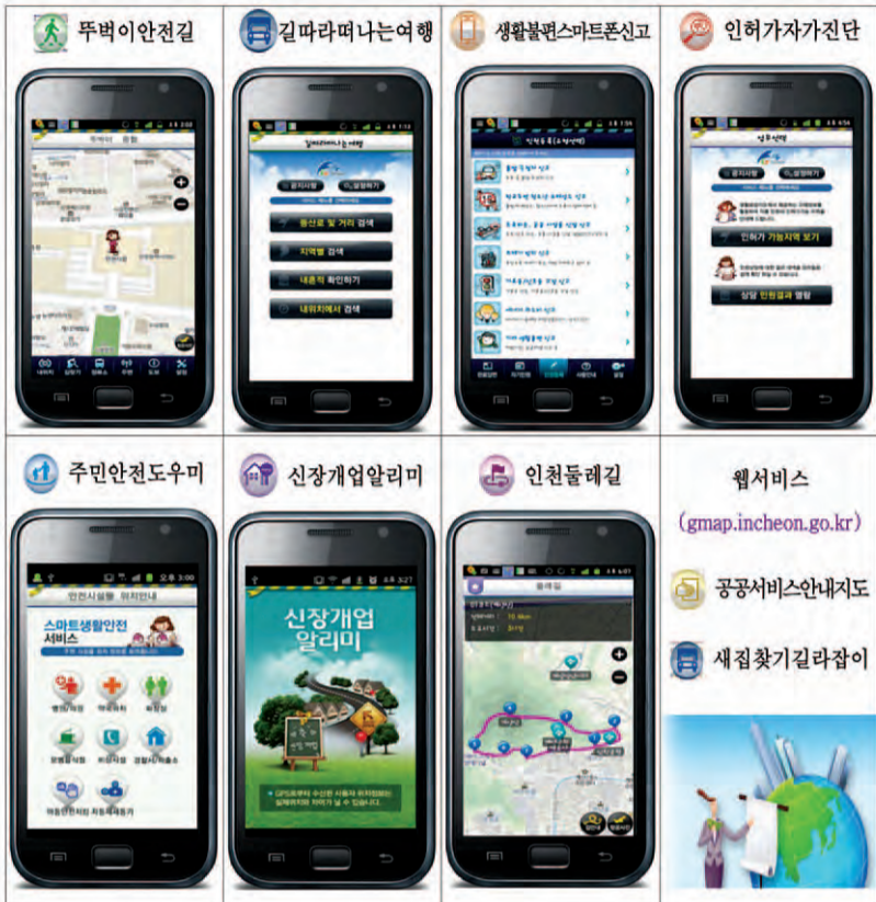
문의) 기획홍보실 ☎560-4082