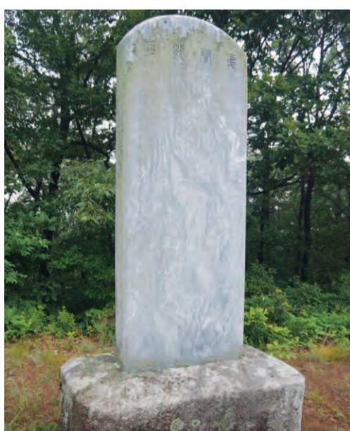
이간공 신도비 앞면

신영(申瑛, 1499~1559)은 중종조(1516)에 진사시에 합격하고 알성문과에 장원으로 홍문관에 등용되어 벼슬길에 올라 여러 관직을 두루 거쳐 한성부 서윤·이조·호조·예조·병조참판을 10여 년간 지내고 그 후 대사헌·대사간·호조판서를 역임했고 말년에 우참찬에 올라 지중