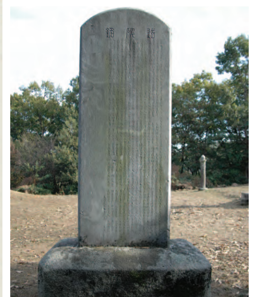
이간공 신도비 뒷면

추부사에 이르러 사직했으며 사후 이간이란 시호가 내려져 신도비를 세웠다(1573).