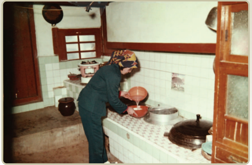
사진 속의 주인공은 백석동 어느 맥 주부였는지는 모르나 방금 식구들 저녁상을 안치려는지 플라스틱 바가지로 밥물을 잡고 있다. 주부의 복장이 역시 새마을운동의 여파였을 터인데 제복처럼 단출하고 간편한 복장

에 머리에는 세수수건이 아닌 스카프를 쓰고 있다. 옛날 할머니, 어머니 들은 부엌에 들어가실 때는 철칙처럼 머리에 수건을 쓰셨다.