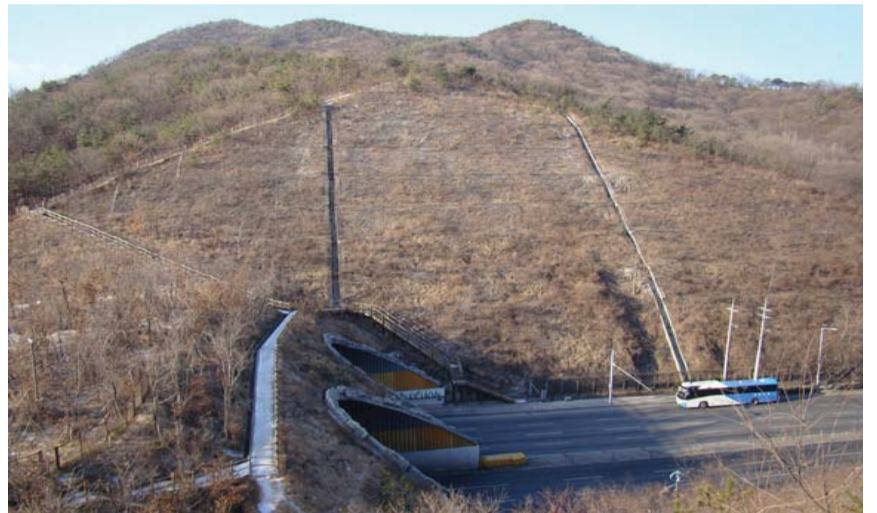
응방(鷹坊) 소재지였던 서구 공촌동 산 163번지 '징매이 고개'

'경명현'은 공촌동에 속했으며 옛 지명은 고현리(古縣里)로 불려왔고 옛 문헌에는 '경명현(폐현지) 계양산 북쪽만일사하평탄지 민호이백야'