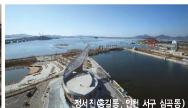
정서진(홍길동, 인천 서구 심곡동)