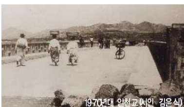
1970년대 인천교(서인 김운석)