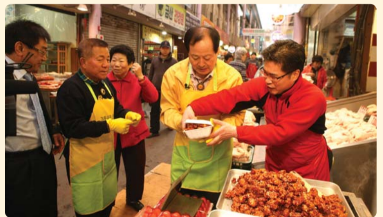
서구 전통시장 안내