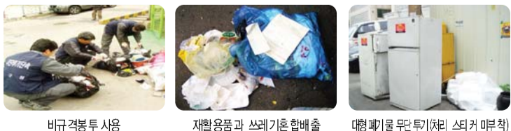
비규격봉투 사용 재활용품과 쓰레기 혼합배출 대형폐기물 무단투기(처리 스티커 부착)