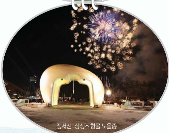
정서진 상징조형물 노을중