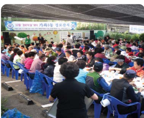
| 가좌3동 | 지난 1일 9개 자생단체 주관으로 관내 어르신 500여 분을 모시고 정성스럽게 준비한 갈비탕으로 어르신들께 따뜻함을 전하였고, 흥겨운 노래자랑과 각설이 공연을 진행하여 어르신들께 즐거움을 선사하였다.