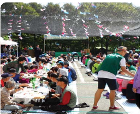
| 가좌2동 | 새마을협의회와 부녀회에서 관내 자생단체의 후원을 받아 지난 1일 어르신 500여 분을 모시고 정성껏 준비한 음식을 대접하고 흥겨운 축하공연 시간을 가졌다.