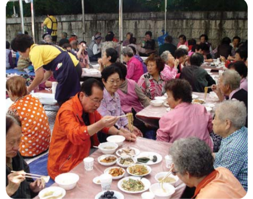
| 가정3동 | 통장자유회 등 5개 자생단체는 지난 1일 경로잔치를 열어 어르신들께 손수 마련한 음식을 대접하고 주민자치센터 민요반에서 국악한마당을 열어 노래와 가무를 즐기는 흥겨운 시간을 가졌다.