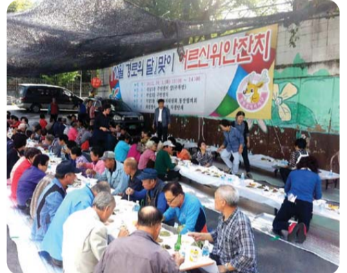
| 석남3동 | 지난 1일 주민자치위원회와 통장협의회가 주관하고 화엄정사와 석남3동 자생단체가 후원하여 관내 어르신 300여 분을 모시고 정성껏 준비한 음식을 대접하였다.