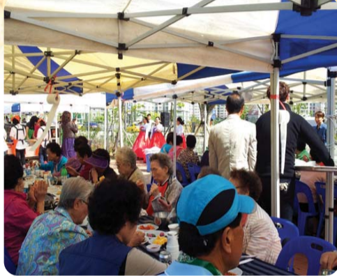
| 청라2동 | 주민자치위원회, 통장자유회는 지난 1일 어르신 350여 분을 모시고 맛있는 음식을 대접하고 흥겨운 노래한마당 잔치를 열었다.