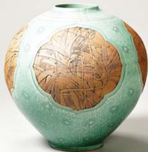
2012 전통도자 부문 대상