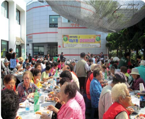
| 석남동 | 지난 1일 주민자치위원회를 비롯한 6개 자생단체 주관으로 어르신 700여 분을 모시고 경로잔치를 열어 정성껏 준비한 음식을 대접하였다. 또한 이날 90세 이상의 장수 어르신 3분을 선정하여 표창하는 자리도 함께 마련되었다.