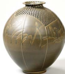
2012 전통도자 부문 우수