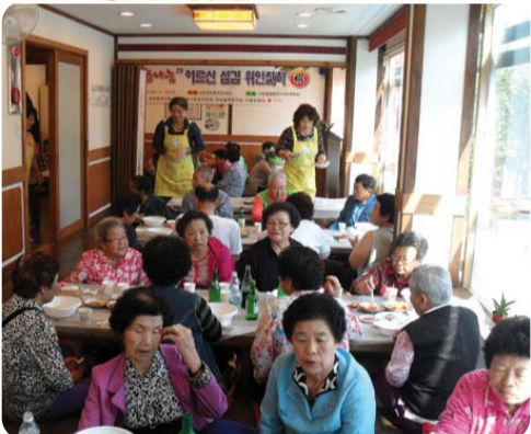
| 신현원창동 | 주민자치위원회 주관, 통장자유회 및 각 자생단체의 후원으로 지난 1일 신현동 소재의 음식점에서 어르신 400여 분을 모시고 경로잔치가 열렸다.