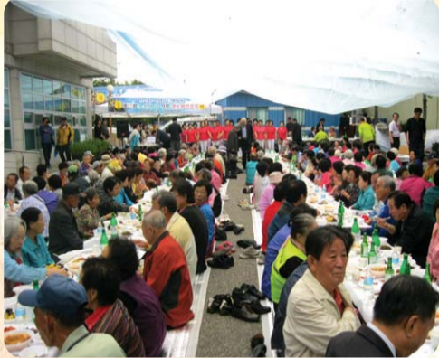
| 검암경사동 | 주민자치위원회, 바르게살기위원회, 새마을부녀회는 지난 8일 어르신 500여 분을 모시고 경로위안잔치를 열어 국악공연과 최고령 어르신에게 장수상과 기념품을 증정하는 시간을 가졌다.