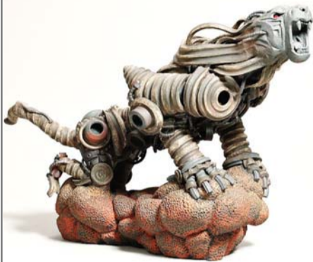
2012 현대도자 부문 대상