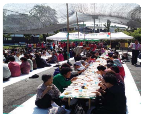
| 가좌4동 | 주민자치위원회의 9개 자생단체에서는 지난 1일 가좌어린이공원에서 관내 어르신 400여 분을 모시고 정성껏 마련한 음식을 대접하고, 민요, 각설이 공연 등 흥겹고 뜻 깊은 자리를 가졌다.