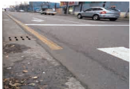
블랙아이스로 도로가 젖은 상태

후 추락 직전 난간에 매달리는 사고가 발생하여 대형사고로 이어질 수 있는 상황이었다. 이 사고는 블랙아이스(Blackice)를 모르는 운전자가 방심해서 운전한 결과로 나타났다.